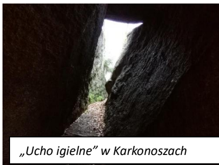
„Ucho igielne” w Karkonoszach

Podstawowym kontekstem dla tej hiperboli jest pytanie o to „Kto może być zbawionym” (por. Mt 19,25)? Jedyną właściwą odpowiedzią jest: „Nikt nie może być zbawionym przez własne wysiłki”. Przykład z bogaczem/bogatym młodzieńcem ma znaczenie drugorzędne – dobrze ilustruje jednak próby zapewnienia sobie wstępu do Królestwa Bożego dzięki wypełnianiu nakazów Prawa, którym nie towarzyszy zmiana