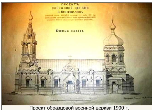
Проект образцовой военной церкви 1900 г.

Lublin, Końskie, Staszów, Zamość, Przasnysz, Kazuń Nowy, Warszawa). Niektóre zostały rozebrane – inne mają z kolei na tyle zmienioną architekturę, że trudno rozpoznać ich pierwotną formę.