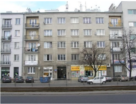
ul. Grochowska 280

4 stycznia 1901 roku po raz pierwszy ulicą pojechała tzw. Kolej Jabłonowska, co z pewnością wpłynęło na rozwój różnych wytwórni i fabryczek. Z tego czasu zachowały się zdjęcia parowej lokomotywy zostawiającej za sobą kłęby dymu. Tę wąskotorową kolejkę zlikwidowano dopiero w 1952 roku.